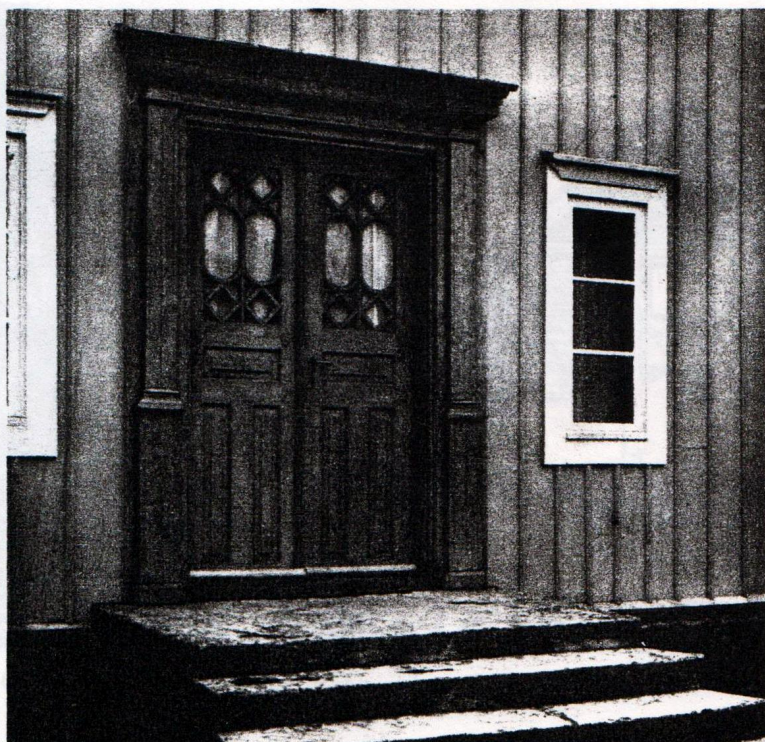
76 a. Hederströmska gårdens port. Foto Erik Andrén 1933.