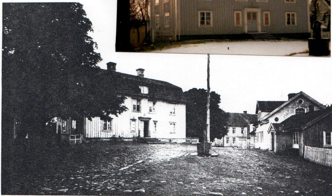
69. Pataholms torg med Hederströmska gården t. v. 1926.