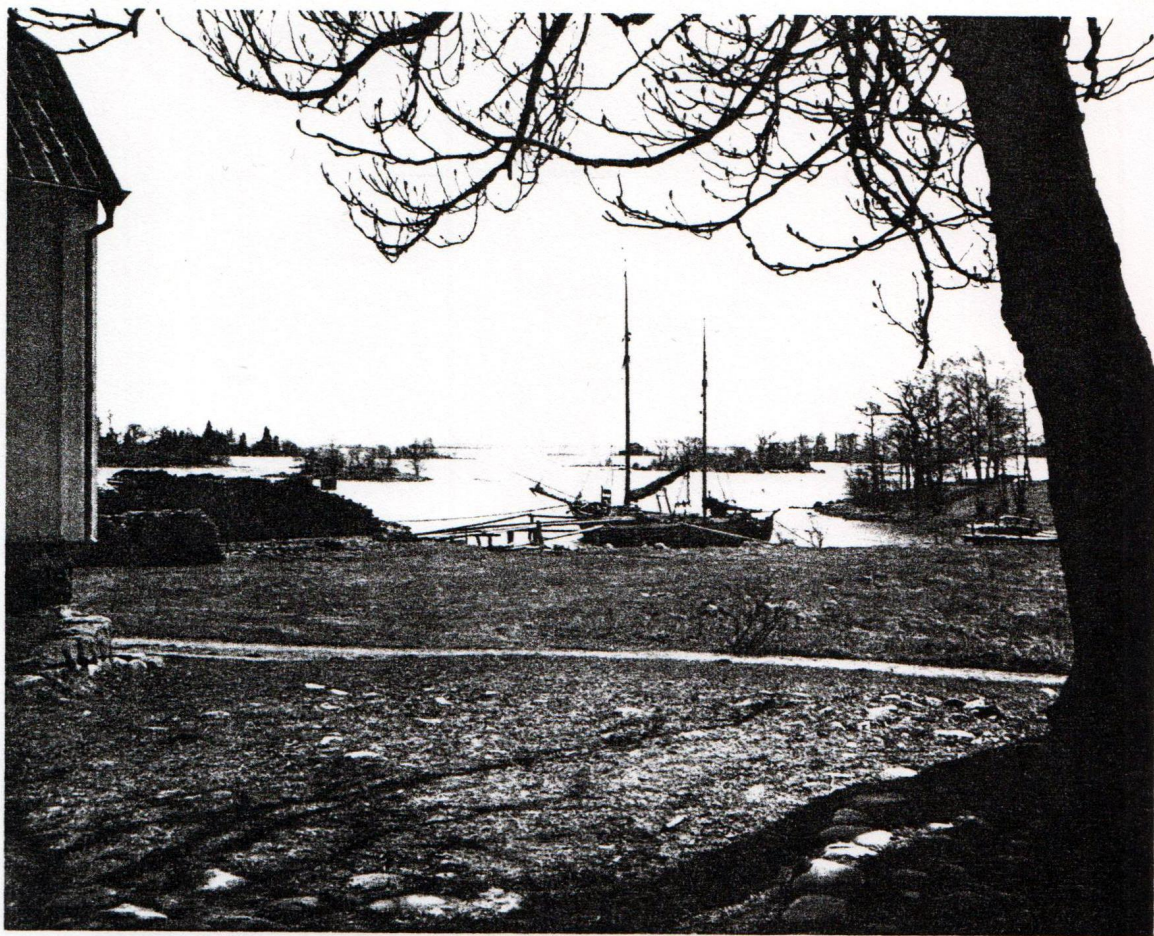
65. Pataholms hamn med galeasen »Förlig Wind» lastande ved. Foto Manne Hofrén 1946.

Dessa två bilder är hämtade ur Manne Hofréns bok "Pataholm" sid. 106 (övre bilden) och sid. 113 (nedre bilden). - Det övre fotot är taget från en plats på Torget mellan posthuset och "Slottet". Bortom fartygets bakre mast ser man Badholmen.